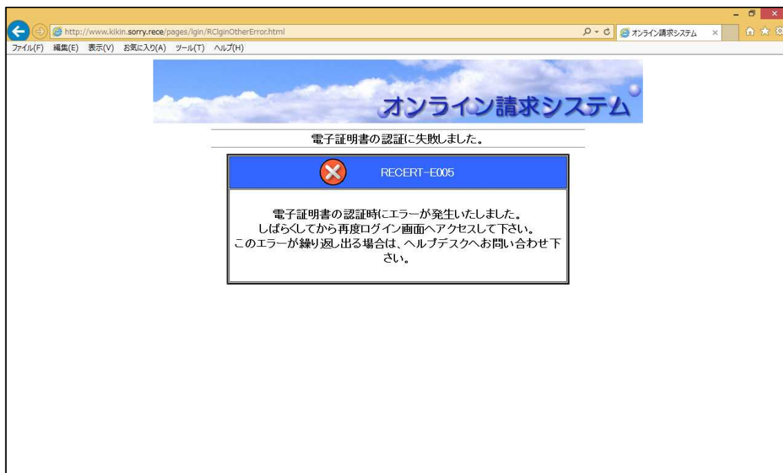
<図1. 電子証明書の認証エラー画面>

なお、12月中は、新電子証明書をインストールされた場合でも、現行の電子証明書を削除しないようにご留意願います。